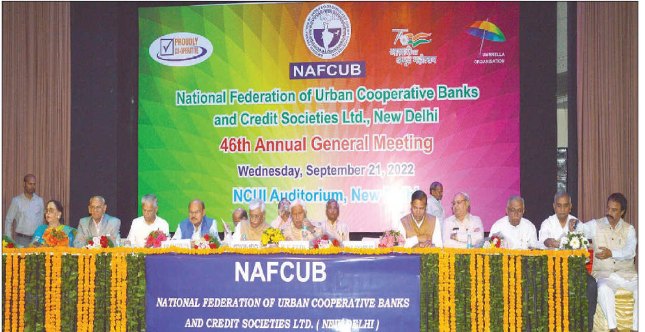
ರಾಷ್ಟ್ರೀಯ ಪಟ್ಟಣ ಸಹಕಾರ ಬ್ಯಾಂಕುಗಳ ಮತ್ತು ಪತ್ತಿನ ಸಂಘಗಳ ಮಹಾಮಂಡಳದ 46ನೇ ವಾರ್ಷಿಕ ಸರ್ವಸದಸ್ಯರ ಮಹಾಸಭೆ