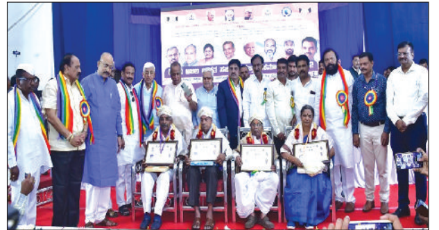
69ನೇ ಅಖಿಲ ಭಾರತ ಸಹಕಾರ ಸಪ್ತಾಹ ಸಮಾರಂಭ - 2022