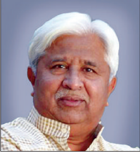
ಶ್ರೀ ಎಚ್.ಕೆ. ಪಾಟೀಲ ಅಧ್ಯಕ್ಷರು