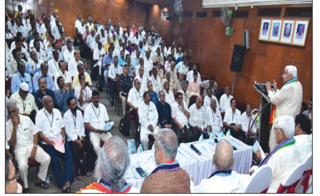
ಮಹಾಮಂಡಳದ 57ನೇ ವಾರ್ಷಿಕ ಸರ್ವಸದಸ್ಯರ ಮಹಾಸಭೆಯ ಛಾಯಾಚಿತ್ರಗಳು