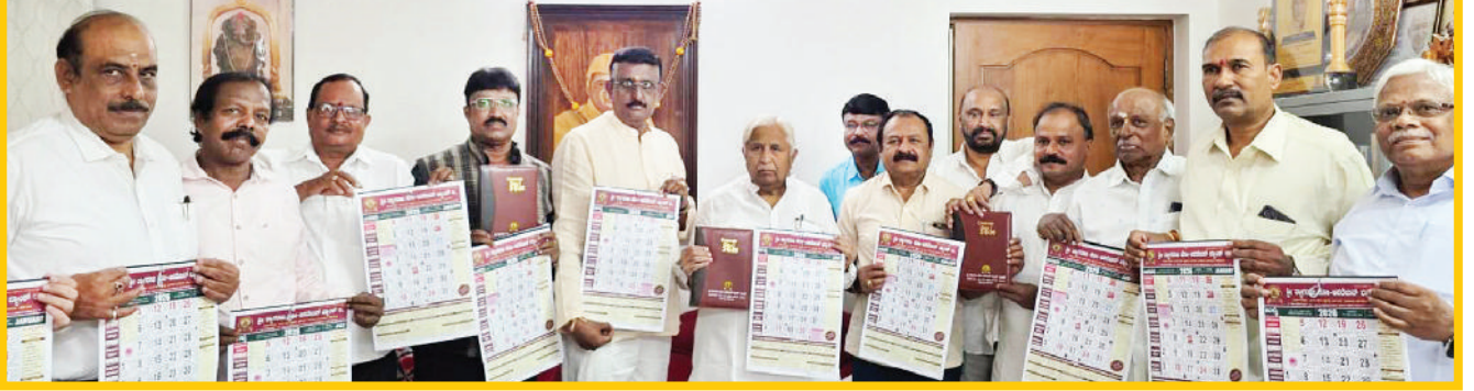
ಶ್ರೀ ತ್ಯಾಗರಾಜ ಕೋ-ಆಪರೇಟಿವ್ ಬ್ಯಾಂಕಿನ 2026ರ ಕ್ಯಾಲೆಂಡರ್ ಮತ್ತು ಡೈರಿಯನ್ನು ಮಾನ್ಯ ಕಾನೂನು ಮತ್ತು ಸಂಸದೀಯ ವ್ಯವಹಾರಗಳು ಹಾಗೂ ಪ್ರವಾಸೋದ್ಯಮ ಸಚಿವರಾದ ಶ್ರೀ ಎಚ್.ಕೆ.ಪಾಟೀಲರು ಬಿಡುಗಡೆ ಮಾಡಿದರು.